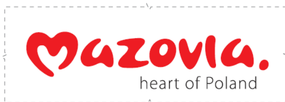
tło podstawowe – białe

(Prostokątne formy opisujące logotypy nie stanowią ich integralnej części, symulują jedynie tło, na jakim znajduje się logotyp).