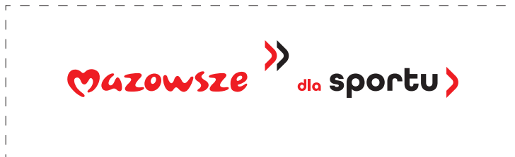
Zmiany położenia elementów w logotypie