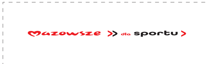
Zmiany wielkości bez zachowania proporcji logotypu