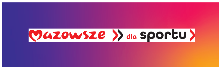
Logotyp umieszczony w polu mniejszym niż rozmiar pola ochronnego