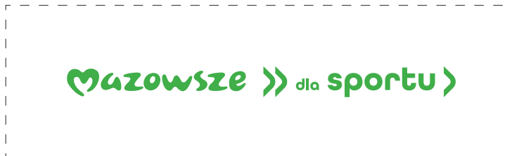
Zmiana koloru logotypu