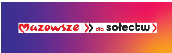
Logotyp umieszczony w polu mniejszym niż rozmiar pola ochronnego