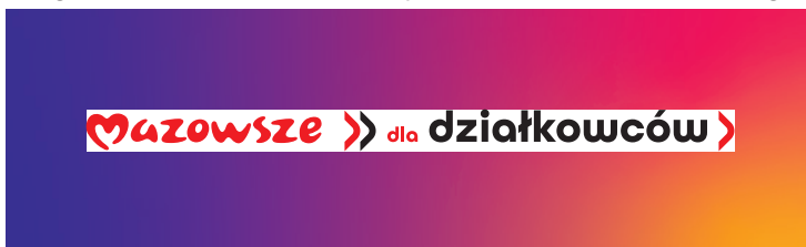
Logotyp umieszczony w polu mniejszym niż rozmiar pola ochronnego