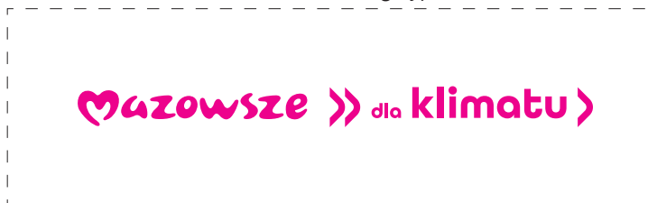
Zmiana koloru logotypu