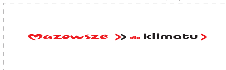
Zmiany wielkości bez zachowania proporcji logotypu