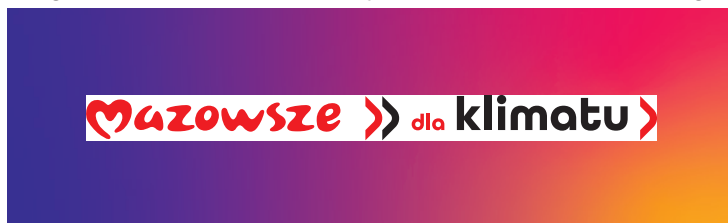
Logotyp umieszczony w polu mniejszym niż rozmiar pola ochronnego