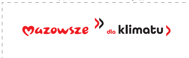
Zmiany położenia elementów w logotypie