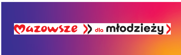
Logotyp umieszczony w polu mniejszym niż rozmiar pola ochronnego