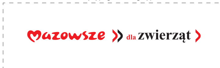
Zmiany typografii w logotypie