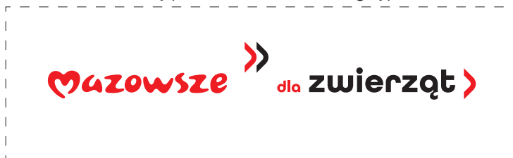
Zmiany położenia elementów w logotypie