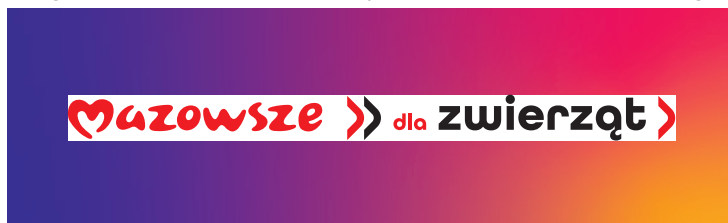
Logotyp umieszczony w polu mniejszym niż rozmiar pola ochronnego