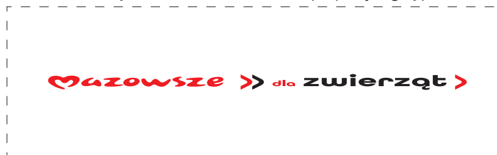
Zmiany wielkości bez zachowania proporcji logotypu