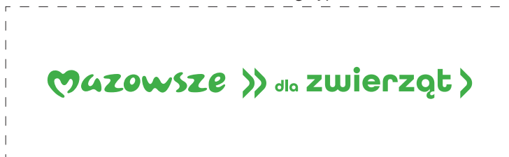
Zmiana koloru logotypu