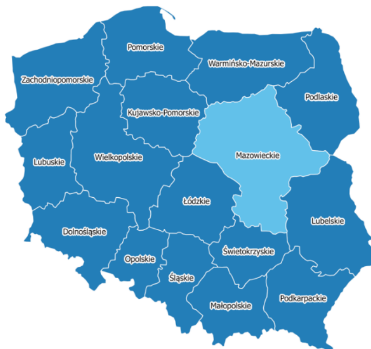
Rysunek 1 Położenie województwa mazowieckiego w Polsce 30